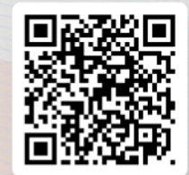
VALIDADOR DEL CERTIFICADO

SEMAP-04-18391202351 Fecha de expedición 18 de diciembre de 2023